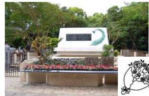
おきなわで亡くなった女子中学生 のお墓

★世界中の人々は、日本人の優しい心、 公德心 に 感動したそうです。★人のために正しいと思うこと を、進んで 実行 する日本人の姿が、世界中でおお きく 紹介 されました。