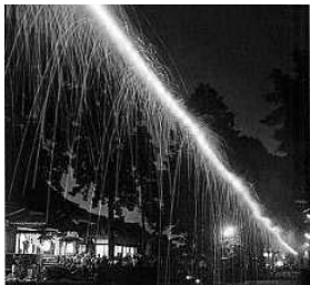
とよかわの おまつり

たり、みることが できるように、どようびと にちようびに おこないます。すこしだけ せつめいを かきました。 カラーしゃしんで みると とても きれいです。