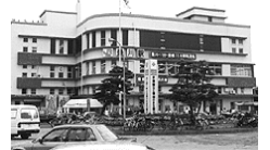
むかし とよかわえき (昔の豊川駅)

をやる伝統がありました。 浄瑠璃という難しい歌に合わ せて、気持ちをあらわす難しい ドラマです。大人でも難しいの ですが、十月五日に、赤坂小 学校の子が猛練習をして、みん なに見せました。特別な化粧を して頑張った子たちに、見た人た ちは、いっぱい拍手をおくりま した。このドラマには普通、「お やま」と言われる、男の人が女 の役をやります。