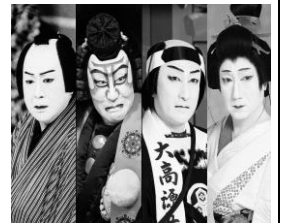
がんば 頑張っている みんな男の人で あかさかしょう 赤坂小の子です とくべつ 特別な化粧です。