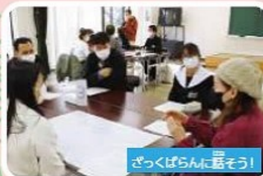
ざっくばらんに話そう!