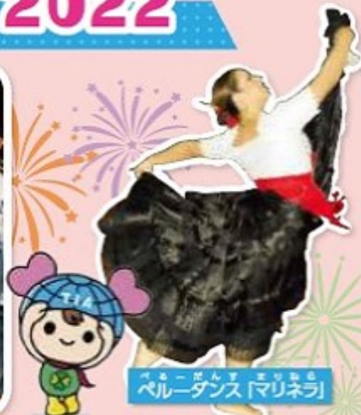
ペルーダンス「マリネラ」